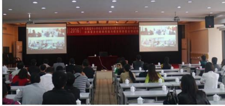
学员们在认真听讲

实践出真知，参训学员纷纷表示，这次培训虽然时间短，但信息量大，注重实践运用，让大家耳目一新。为期三天的短暂培训虽然结束了，但是参训教师们却如同此时的季节一样，满载着丰硕的果实回到了自己的工作岗位之上，在远程培训开始的号角声中绽放自己的光彩！